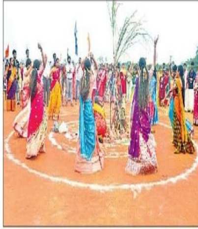
ఉషారామలో నృత్యాలు చేస్తున్న విద్యార్థినులు

పెనమలూరు: పెనమలూరు, గన్నవరం నియోజకవర్గాల వ్యాప్తంగా నిర్వహించిన ముందస్తు సంక్రాంతి సంబరాలు ఉత్సాహంగా సాగాయి. వివిధ విద్యా సంస్థల్లో భోగి మంటలు, రంగురంగుల ముగ్గులు, గొబ్బెమ్మలు, గంగిరెడ్డుల విన్యాసాలు, హరిదాసు కీర్తనలు, విద్యార్థుల కోలాటాలతో విద్యార్థులు ఆనందంగా గడిపారు. అనంతరం గాలిపటాలు ఎగురవేసి, పొంగల్లు వండారు. సంప్రదాయ దుస్తులు ధరించి ఆకట్టుకున్నారు. కానూరు సిద్ధార్థ డిప్యూటీ టూబీ యూనివర్సిటీలో శనివారం సాహిత్య, సంస్కృతి సమితి, ఎన్ఎస్ఎస్ ఆధ్వర్యంలో సంస్కృతి సంబరాలు-2026 అత్యంత