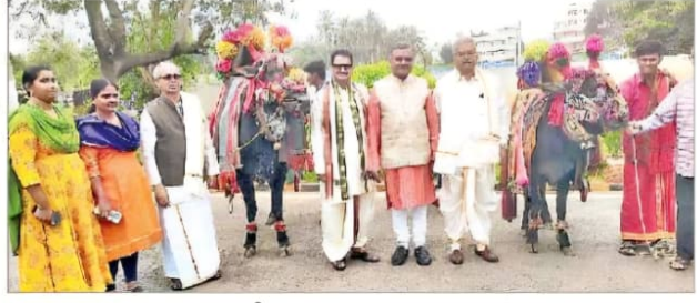
సిద్ధార్థ డీమ్లు విశ్వవిద్యాలయంలో...

సంక్రాంతిని పురస్కరించుకుని శనివారం పెనమలూరు, గన్నవరం నియోజకవర్గాల్లోని పలుచోట్ల ముందస్తు సంబరాలను ఘనంగా నిర్వహించారు. పండగ వాతావరణం ప్రతిబింబించేలా అందమైన రంగవల్లులు, గొబ్బెమ్మలు, భోగి మంటలు, బొమ్మల కొలువు, పాల పొంగళ్ల వంటకాలు, కోలాట ప్రదర్శనలు ఆకట్టుకున్నాయి. - న్యూస్ టుడే, బృందం