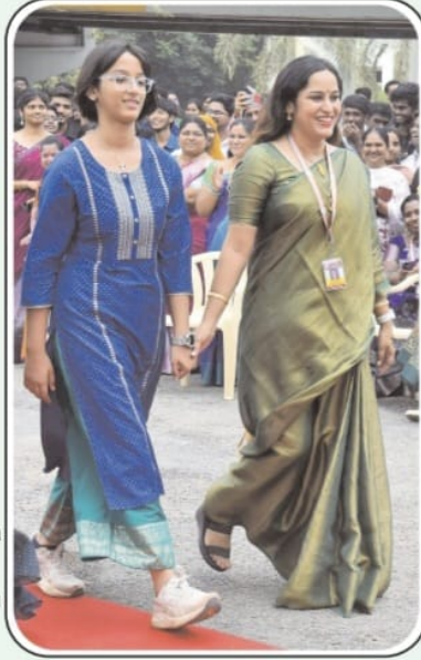
Sankranti Sambaralu-2026 organised by Siddhartha Academy of Higher Education deemed to be University at Kanuru in Vijayawada on Saturday. Large number of students, faculty and management committee participated. Traditional Bhigi Mantalu, Rangoli, Gangireddulu (decorated bulls), Haridasu arranged. Students participated traditional fashion show.