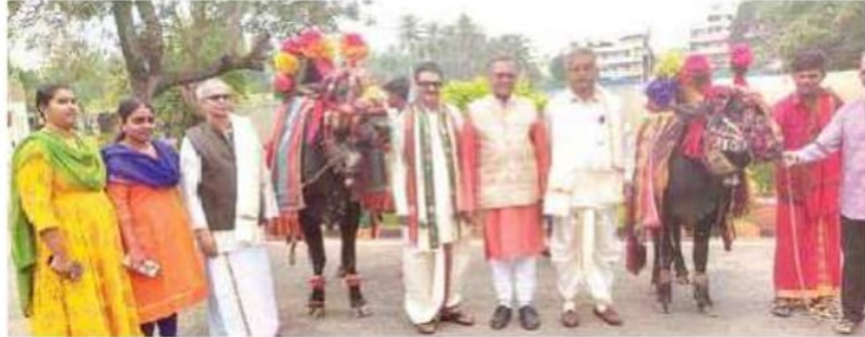
Students and folk artistes, including Gangireddulu performers, adding colour and vibrancy to Sankranti celebrations at the VR Siddhartha campus at Kanuru near Vijayawada on Saturday