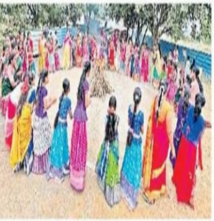
జవహర్ నవోదయలో.. ముస్తాబాద నవభారత్ లో