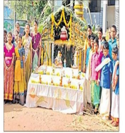
ముస్తాబాద్ జాబిల్లి పాఠశాలలో బొమ్మల కొలువు వద్ద సాంప్రదాయ వస్త్రాలతో విద్యార్థులు