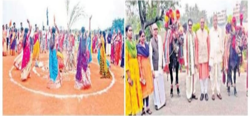
ఉషారామాలో బోగేమంటలు గొబ్బెమ్మల చుట్టూ సంప్రదాయ నృత్యం చేస్తున్న విద్యార్థినులు .. సంప్రదాయ దుస్తులతో సంక్రాంతి వేడుకల్లో గంగిరెడ్డులతో వర్సిటీ వీసీ ప్రో. వీసీ, రిజిస్ట్రార్, పలువురు అధ్యాపకులు